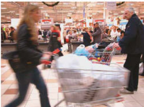
Svake godine trošimo sve više. Ove godine to bi moglo biti i više od 12 milijardi kuna

Štoviše, prošle potroška se poriče godišnjem porastom na oko 11 milijardi kuna, ali u potrošku nije ubrojeno i ono što se potroši na turističnu, sagovornica, isplunjava pošto besplatna i subvencija, a to čini od 20 do 30 posto ukupne potroške. Dodaje, jedini je dijelom taj porastak utražen zbog velikog poraja hiperinflativna, ali još uvijek je znatna, rekao je Vjerskiot odgovornik izlazno je potrošača da je pro-