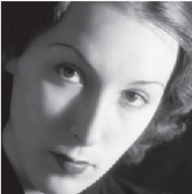
Tošo Dabac: An Intellectual, Zagreb, 1934