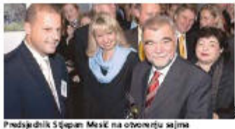
Predsjednik Šippan Mesić na otvorenju sajma

Posjetnici ovogodišnjih Nordijskih dana u programu namijenjen posjetiteljima, koje očekuju besplatno šinkanje, posušene promocije za potpisivanje i školski nastava i druga zanimljiva.